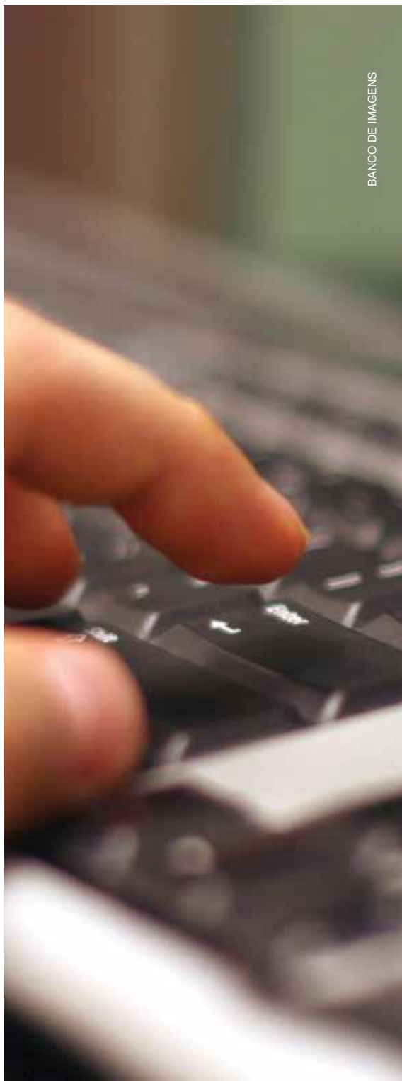
BANCO DE IMAGENS